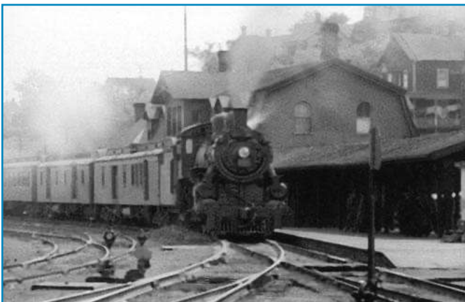
Illustration : Fraserville, vers 1900

Au-delà de ses activités commerciales, Louis-Hubert Levasseur joue un rôle politique majeur. Il devient maire de Fraserville de 1901 à 1905 .