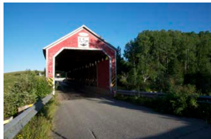
Le pont couvert Levasseur à Authier-nord