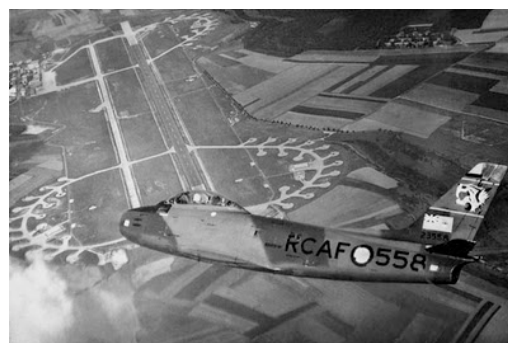
Un Sabre de la RCAF survole sa base de Marville, à la fin des années 50.

Pour nos sorties en couple, nous sommes heureux de pouvoir compter sur les gardiennes de Virton. Elles sont très dévouées et nous pouvons compter sur elles pour l'entretien de la maison. De plus, elles peuvent nous remplacer pendant quelques jours. Ces jeunes filles peuvent permettre à Madame de